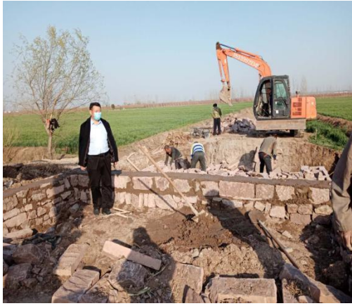
田间桥梁正在施工建设