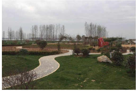
新时代文明实践广场