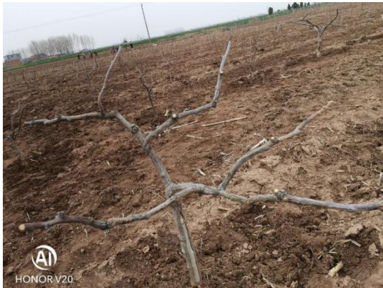
正在建设的种植示范园