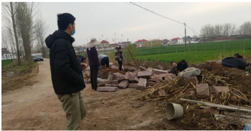
标准化农田建设有序施工中