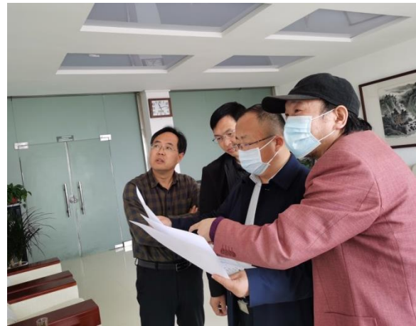
与专家研究农业地质项目