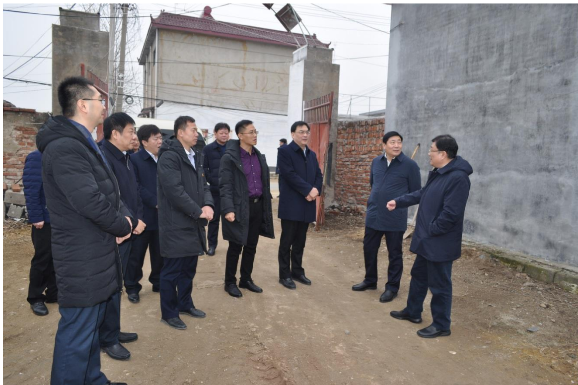
图一：查看扶贫车间选址

职守，担当作为，认真履行职责，依据两年任职规划，有序推进各项工作，始终以一往无前的奋斗姿态，坚决完成第一书记的使命任务，树立省信访局第一书记的良好形象。