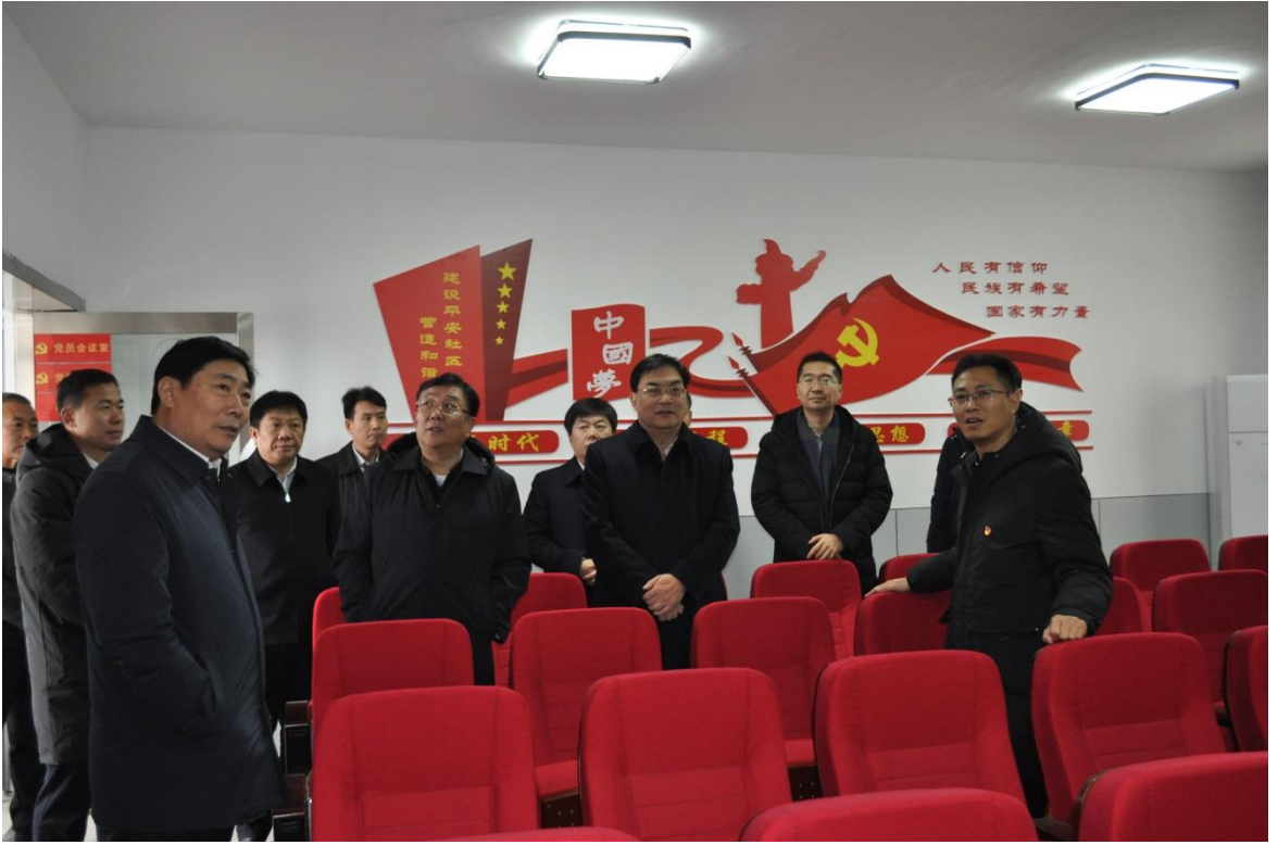
图四：查看东夹卜村党员活动室