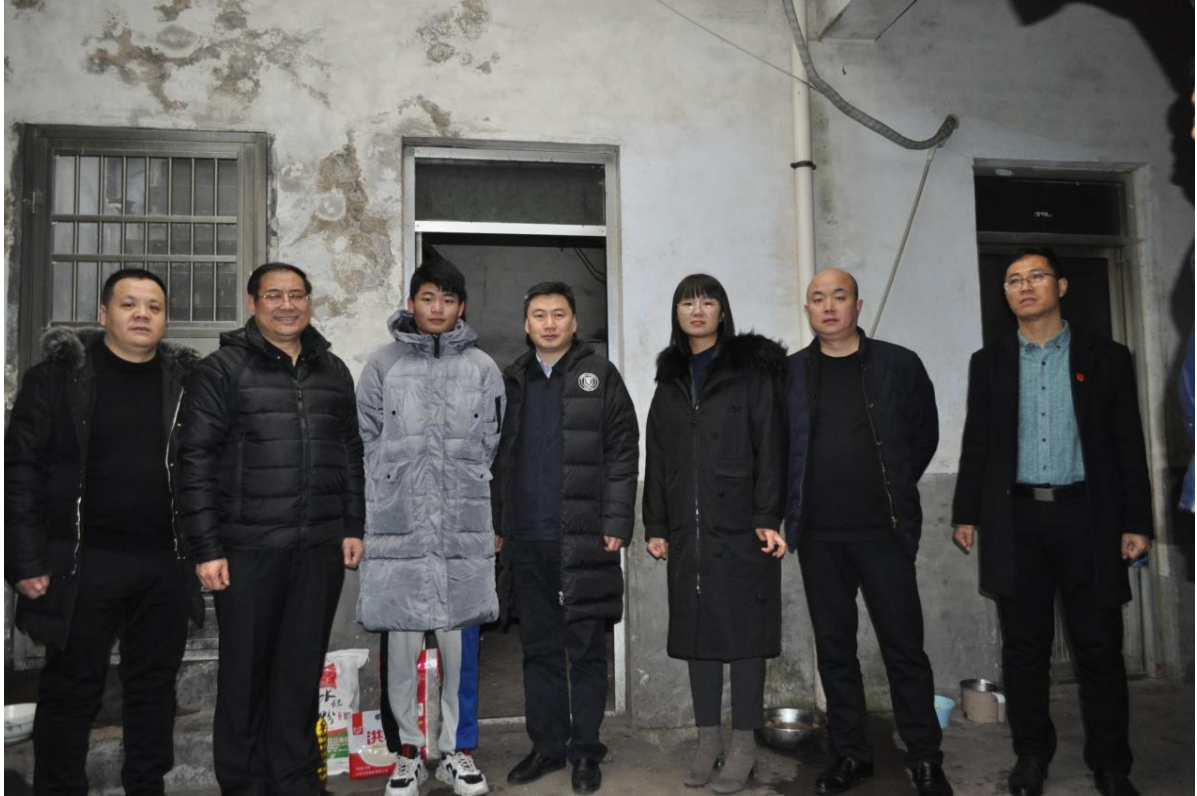
图五：慰问贫困户合影