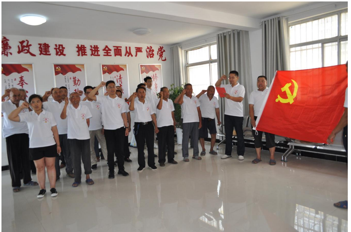
图二：东夹埠村党支部组织重温入党誓词