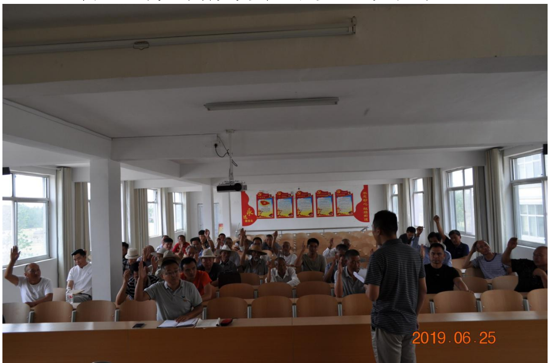
图三：房庄村党支部组织发展预备党员