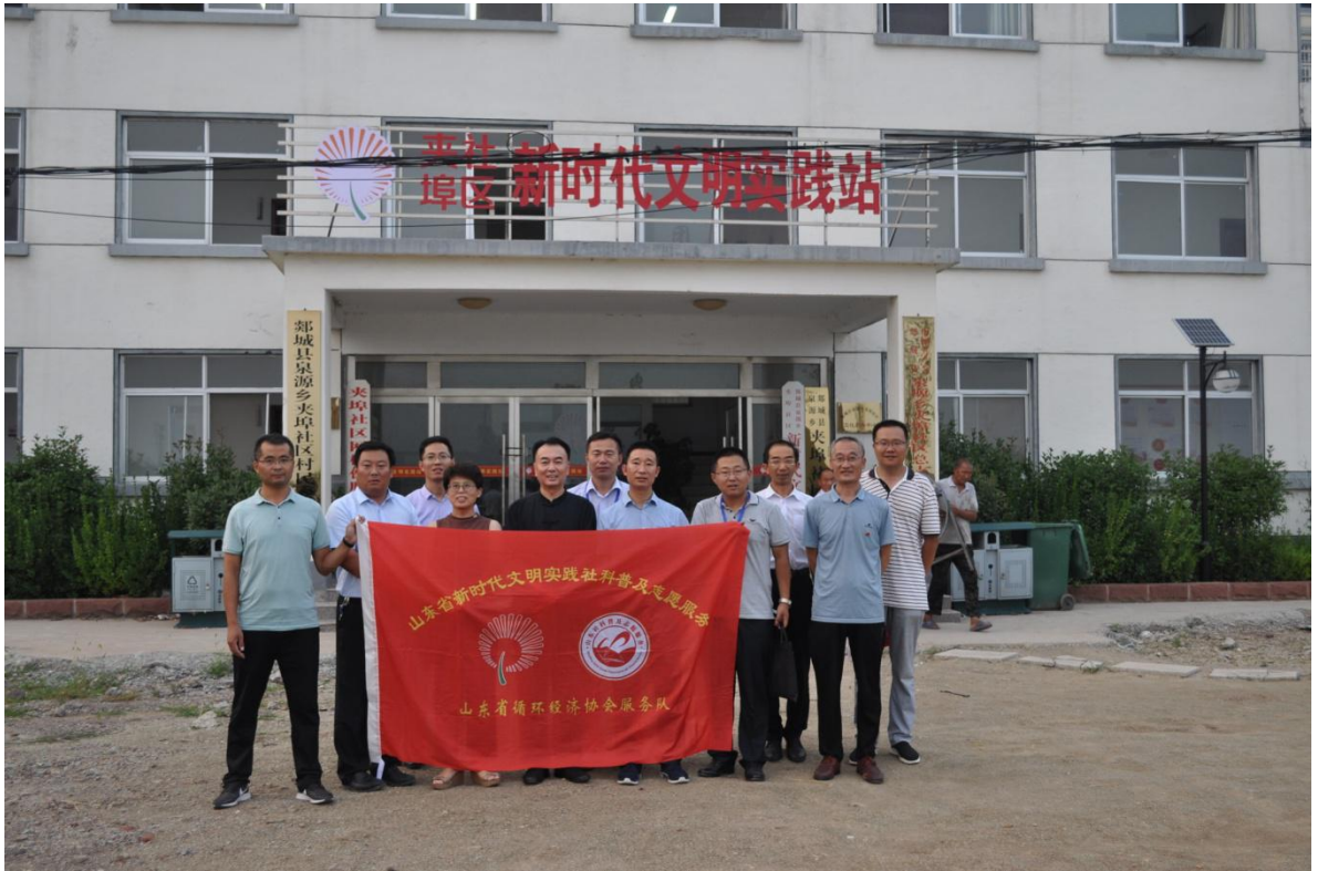
图三：志愿服务队在社区前留影