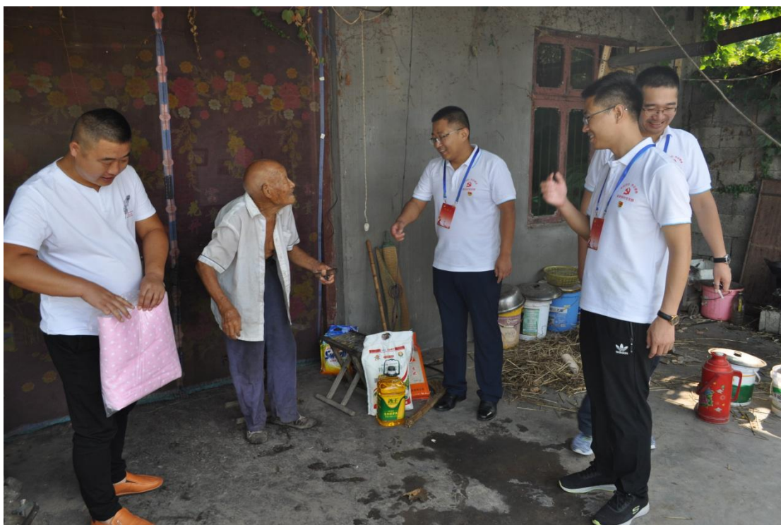
图二：慰问退役军人