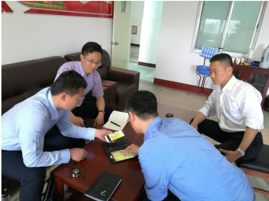
对接建设用地规划